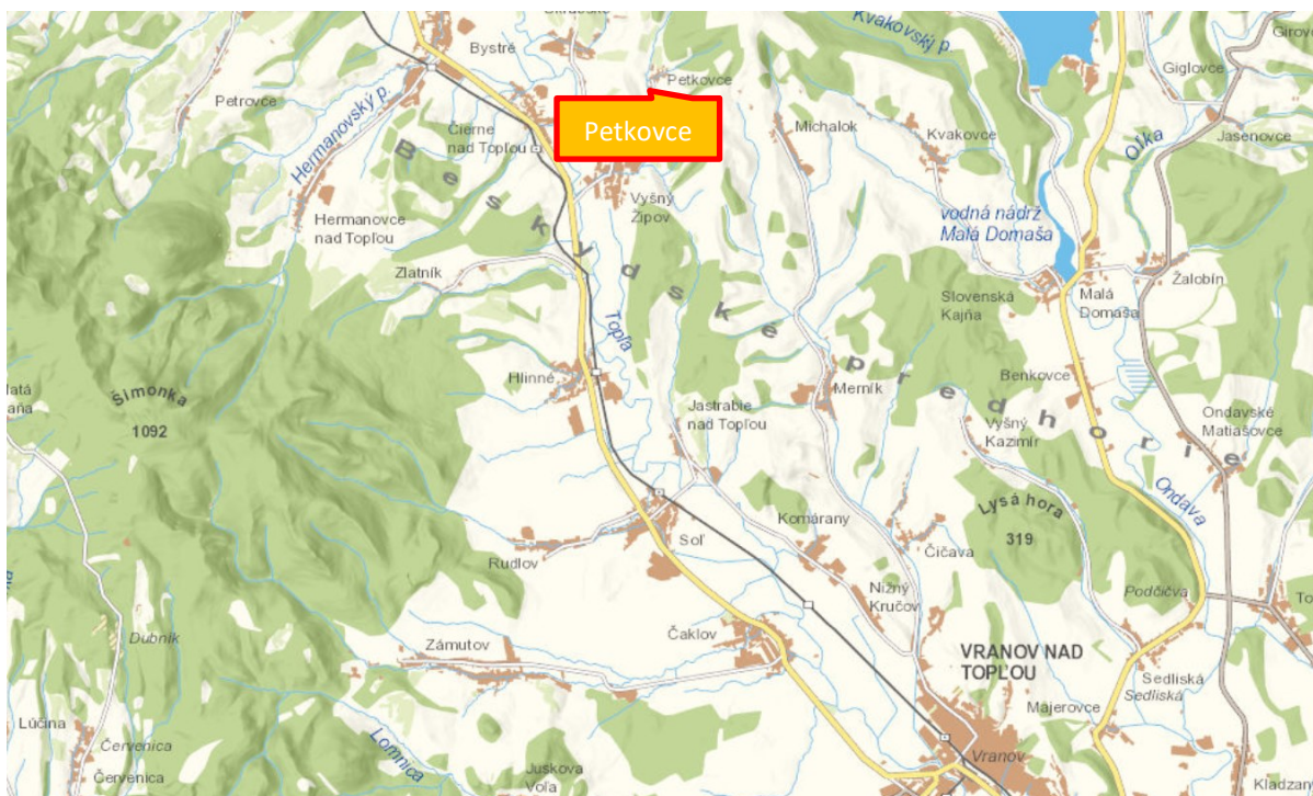
Obrázok č.:1 Poloha obce Petkovce

Poloha a dostupnosť Kataster obce sa rozprestiera v juhozápadnej časti Ondavskej vrchoviny, východne od rieky Topľa. Obec leží 19 km severozápadne od mesta Vranov nad Topľou, mimo hlavných dopravných trás. Kataster obce hraničí na severe a severozápade s katastrom obce Skrabské, južnú a juhovýchodnú hranicu katastra tvorí obec Vyšný Žipov. Na východe hraničí s obcou Michalok.